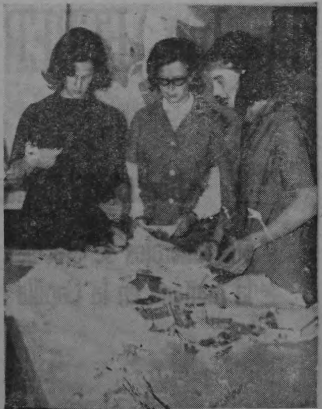
Durante una sesión de trabajo, preparan material de costura.

A sus estimables socios que para mejorar las instalaciones de la piscina quedarán cerradas éstas desde el miércoles 30 de marzo a las 3.30 p. m., hasta el sábado Santo inclusive.