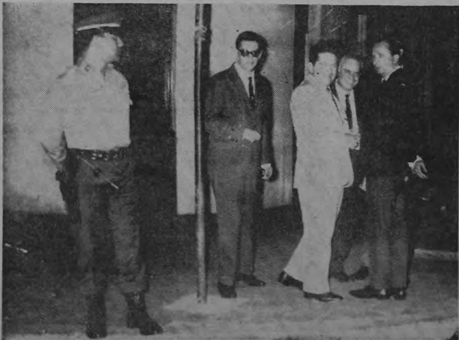
Los médicos integrantes del Comité de Lucha, que ayer se reunieron con el Presidente Orlich y el

Me voy a reunir con los Ministros de Economía en Panamá para programar la política común que seguirá Centroamérica en las reuniones del Consejo Interamericano Económico y Social (CIES) que se llevan a cabo en Buenos Aires y a las cuales asistiré.